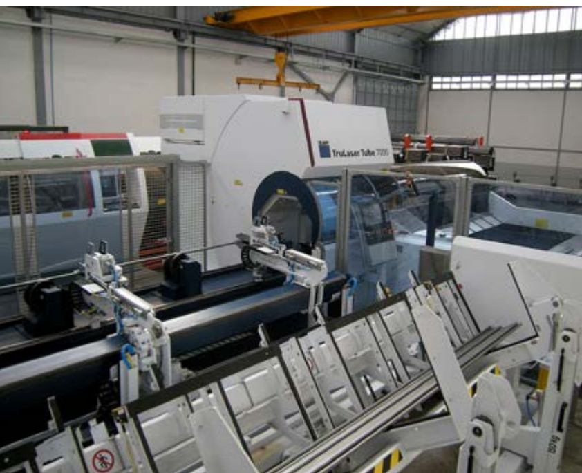
Fasb Linea 2